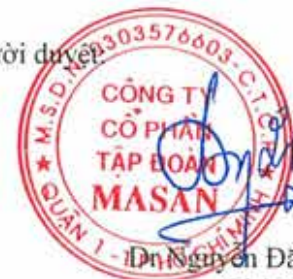
Nguyễn Đăng Quang Chủ tịch Tổng Giám đốc

Các thuyết minh đính kèm là bộ phận hợp thành của báo cáo tài chính riêng này